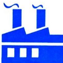
INDUSTRIAS PECUARIAS DÍAZ S.A.C